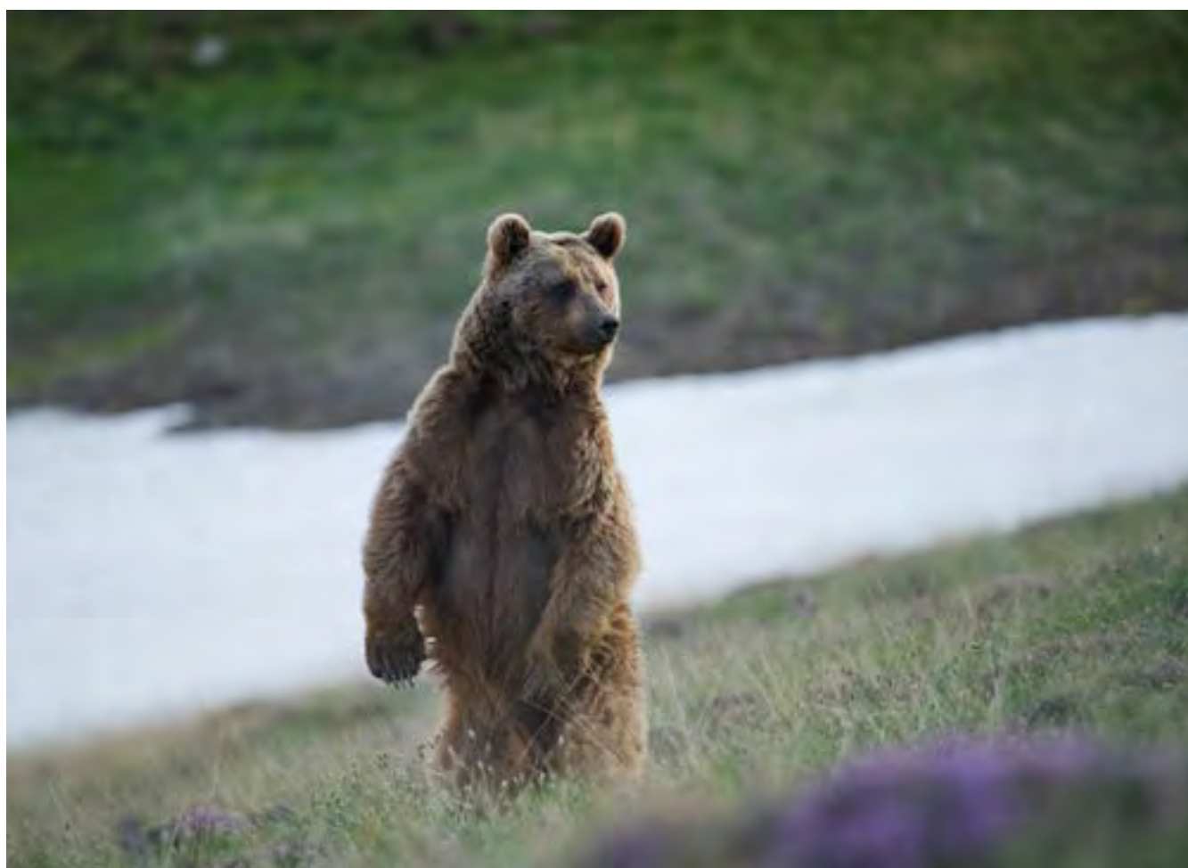
Ours brun d'Europe

Pour finir, il est déconseillé d'utiliser des produits cosmétiques tels que des dentifrices mentholés, car ils peuvent avoir un pouvoir appétant sur ces espèces.