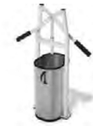
Compacteur OLIFAN manuel : «L' Original» © Waste Allocation Systems 17

Le compacteur de déchet pour réduire les volumes et rendre le transport plus simple. Les déchets sont compactés dans des sacs avec des codes couleurs pour un dépôt simplifié et rapide en déchetterie.