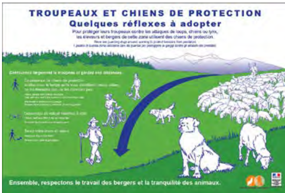
Panneau «Chiens de protection en alpage», qu'il est possible d'observer sur les sites où paissent les animaux au pâturage. Illustration issue du dossier «Chiens de protection : des gestes à adopter», du site Internet du Parc National des Écrins 23

Le retour progressif des grands prédateurs sur le territoire français (Loup, Lynx, Ours) entraîne l'utilisation de chiens de protection de troupeaux (bovins, camélidés, caprins, équins, ovins, ...). Il en découle que les utilisateurs des espaces pastoraux, dont les équipes de tournages, doivent apprendre à pratiquer leurs activités en tenant compte de la présence de ces chiens, élevés au sein des troupeaux pour les protéger de la prédation.