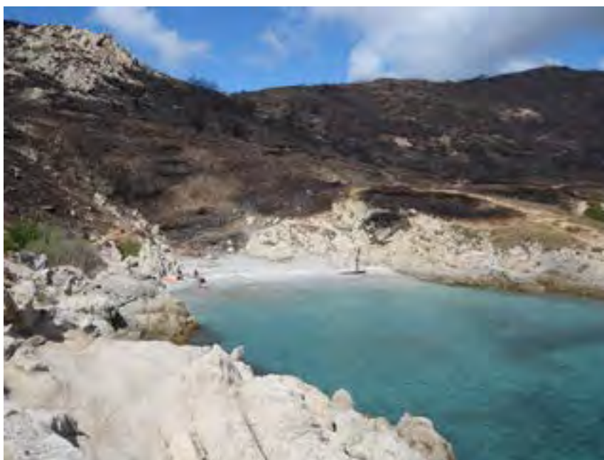
Paysage du Cap Taillat en 2007 après le passage d'un incendie - Parc National de Port-Cros

Les changements climatiques amènent une sécheresse de plus en plus forte sur nos territoires, étalée sur une durée calendaire de plus en plus large. Cette sécheresse fragilise la végétation des espaces naturels face au risque incendie.