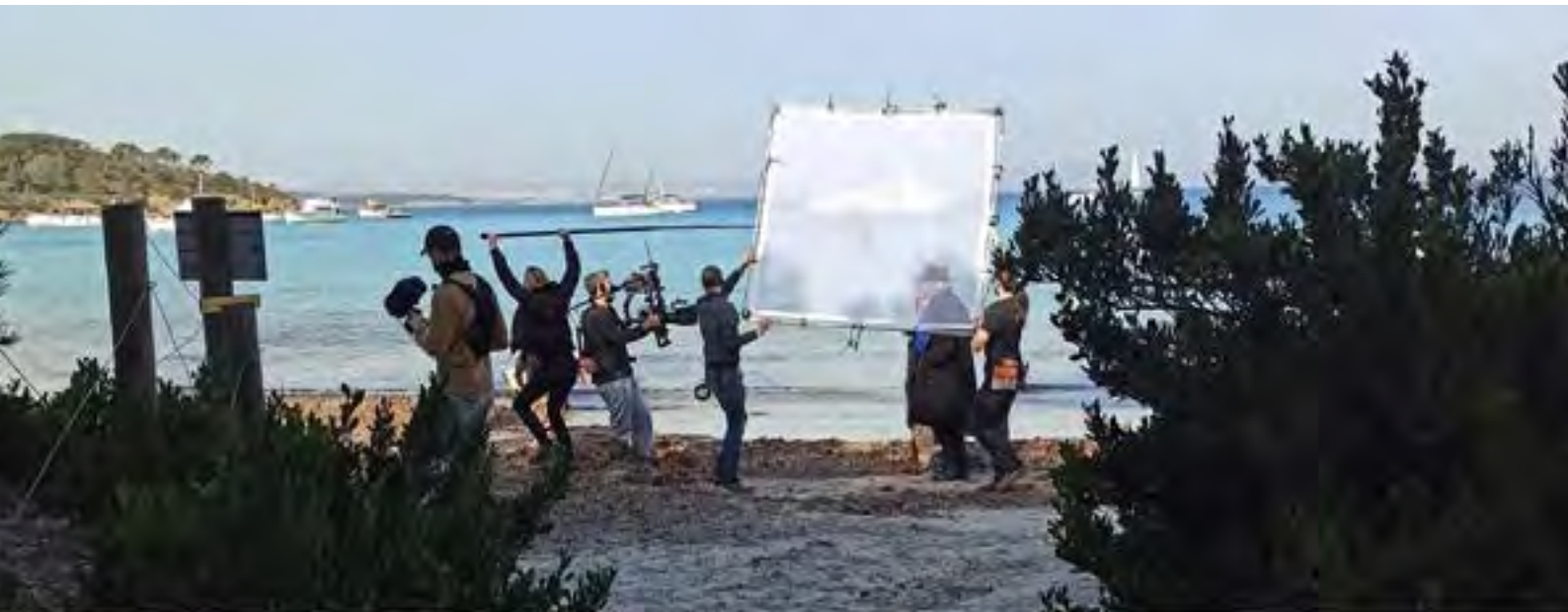
« Tournage sur une plage de l'île de Porquerolles, zone cœur du Parc National de Port-Cros »