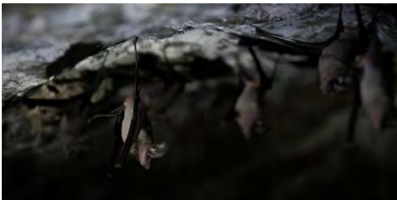
Chauves-souris en sortie d'hibernation

Il est donc important de suivre les recommandations des gestionnaires et de respecter la loi, car toutes les espèces de chauve-souris en France sont protégées 16 . En cas de dérangement volontaire, tout contrevenant s'exposerait alors à une action en justice à son encontre.