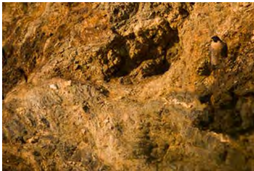
Faucon pèlerin dans son habitat - Donner à voir au public sans permettre la localisation des sites sensibles

- Attraction du public vers des sites sensibles jusqu'alors préservés (exemple : zone de reproduction d'espèces protégées identifiées et données à voir au public sans précaution),