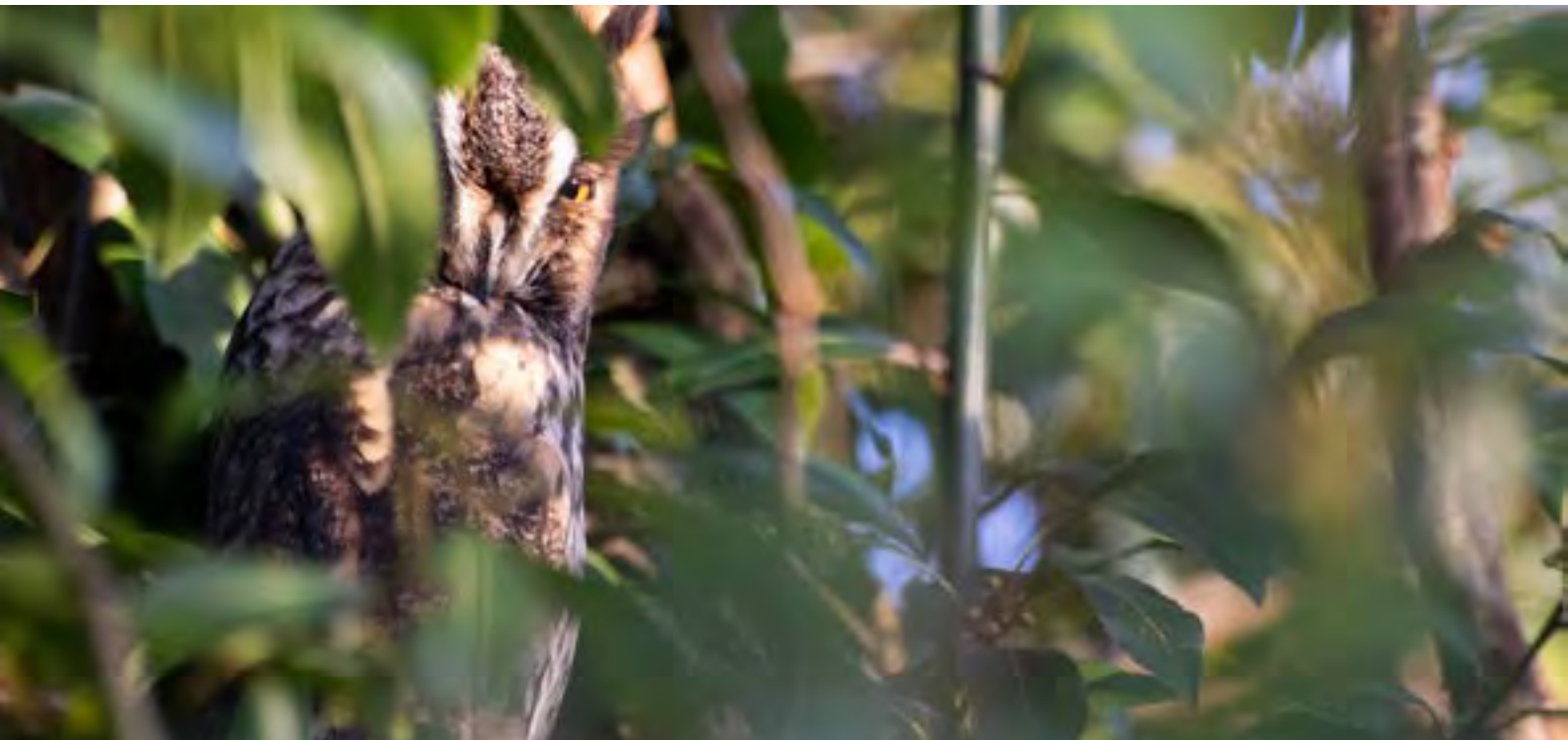
Hibou moyen-duc