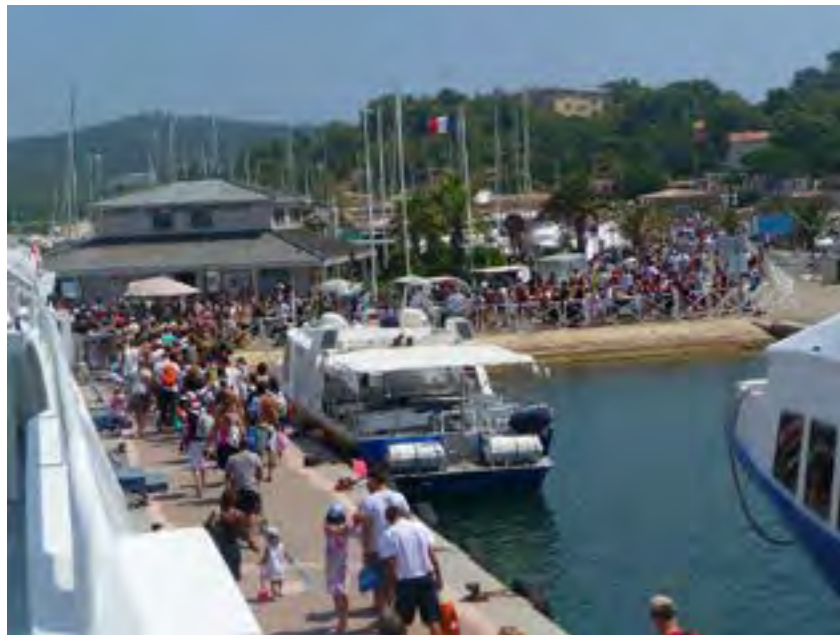
Surfréquentation touristique sur l'île de Porquerolles en 2010 – Parc National de Port-Cros

- Surfréquentation causée par la mise en valeur des sites,