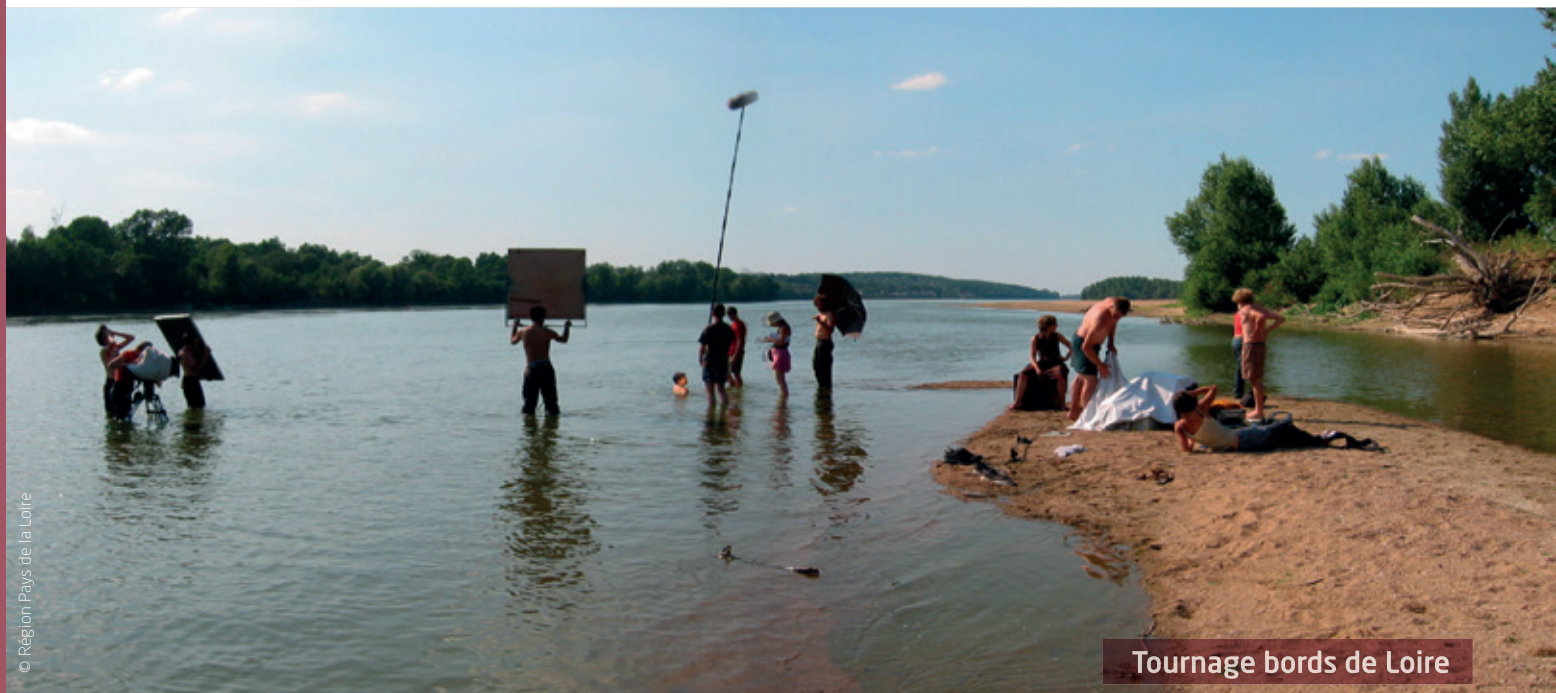
Tournage bords de Loire