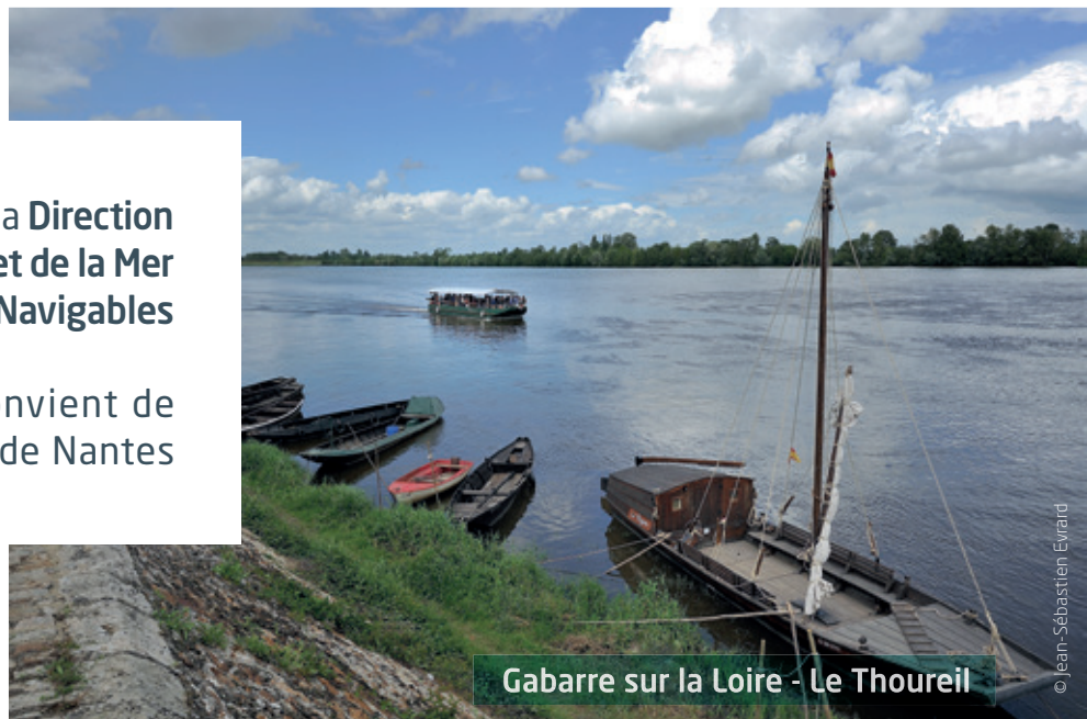
Gabarre sur la Loire - Le Thoureil

📍 10, bd Gaston Serpette - BP 53606 44036 Nantes Cedex 1 🌐 http://www.vnf.fr/ 👤 Nicolas PICHON - Responsable VNF 44 49 ☎ +33 (0)2 40 67 26 01 ✉ uti.loire@vnf.fr