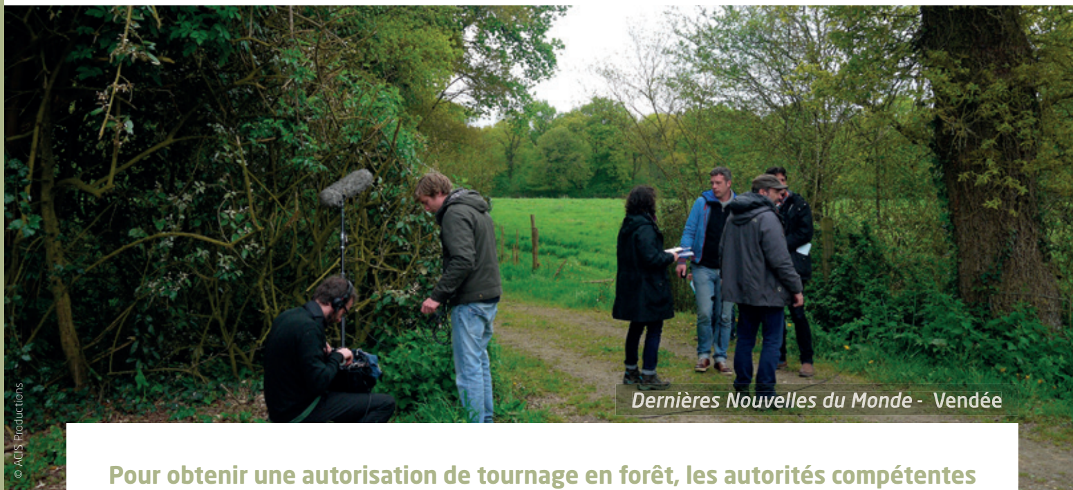
Dernières Nouvelles du Monde - Vendée