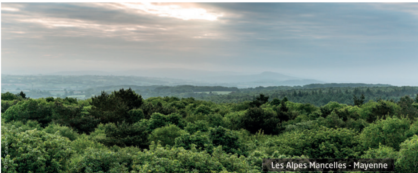
Les Alpes Mancelles - Mayenne

📍 2 boulevard Allard - BP 78749 44187 Nantes Cedex 4 ☎ +33 (0)2 40 44 81 10 ✉ dirm-namo@developpement-durable.gouv.fr 🌐 http://www.dirm.nord-atlantique-manche-ouest.developpement-durable.gouv.fr 👤 Anne RICHARD - Service Communication ✉ anne.richard@developpement-durable.gouv.fr ✉ cce.dirm-namo@developpement-durable.gouv.fr